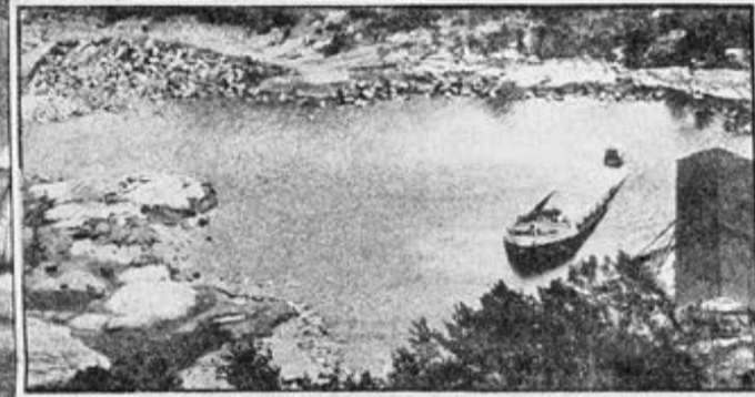
Avfallsfatene ligger tett på vågen. Lekteren har satt seg på bunnen i Kolsøyhamn. Sjøen har losset mesteparten av lasten.

I dag tar Forsvaret af-fære. En liten flåte mar- rinefartøyer la ut fra Haakonsvern i seks-tiden i morges for å delta i oppryddingsarbeidet et- ter avfallslekteren som sank ved Kolsøy i Sunn- hordland andre juledag. Marinen skal ta seg av de fatene som er kommet på rek i fjorden, mens et privat firma skal berge de fatene som ligger i bukten på Kolsøy. Hvor malingsavfallet skal fø- res hen i første omgang. Over til siste side — F