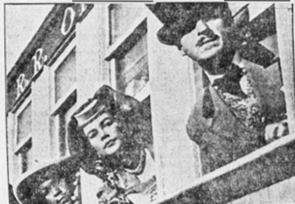
En scene fra «Jorden rundt på 80 dager» med David Niven (t.h.) hovedrollen.

Jules Vernes berømte roman «Jorden rundt på 80 dager» sendes i nyttårshelgen i filmatisert utgave med David Niven, Shirley MacLaine og Robert Newton i hovedrollene. Filmen er fra 1956 og er produsert av Michael Todd med Michael Anderson som regissør. Da spilletiden er ca. tre timer, sendes filmen i to deler.