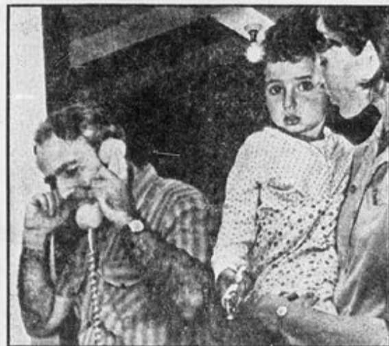
Israels ambassadør i Kambodsja som var blant gislene, snakker med slektninger i telefonen mens kona og datteren til en annen ambas- sadefunksjonær ser på.