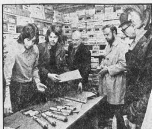
Salget av fyrverkerisaker går godt, og under skikkelig kontroll.

Det er bare to forretninger i sentrum som har tillatelse til salg. Aldersgrensen er 18 år, og kjøpere fra Bergen må underskrive på en liste — samt gi opplysning om hvor fyrverkerisakene skal benyt- tes. De får utdelt en stensil som gir nærmere anvisninger for hvorledes man skal for- holde seg. Likeledes har for- handlerne opphengt kart som viser hvor det er forbud mot bruk av fyrverkerisaker. Dette er i første rekke tett- bebyggelsen i hele gamle Bergen og på Laksevåg.