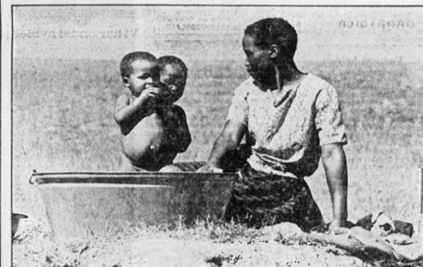
MIDT OPPE i klesvasken står disse afrikanske guttene — mer opptatt av fotografen enn av morens arbeid.