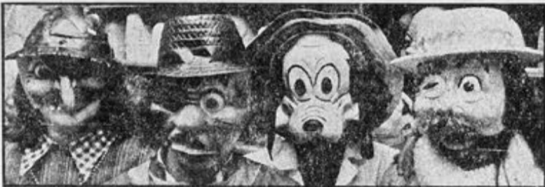
4 ekspeditriser viser sine «favoritt-masker». Av Pluto's ansiktsuttrykk skulle man tro hande- len gikk dårlig — noe som ikke er tilfelle. —